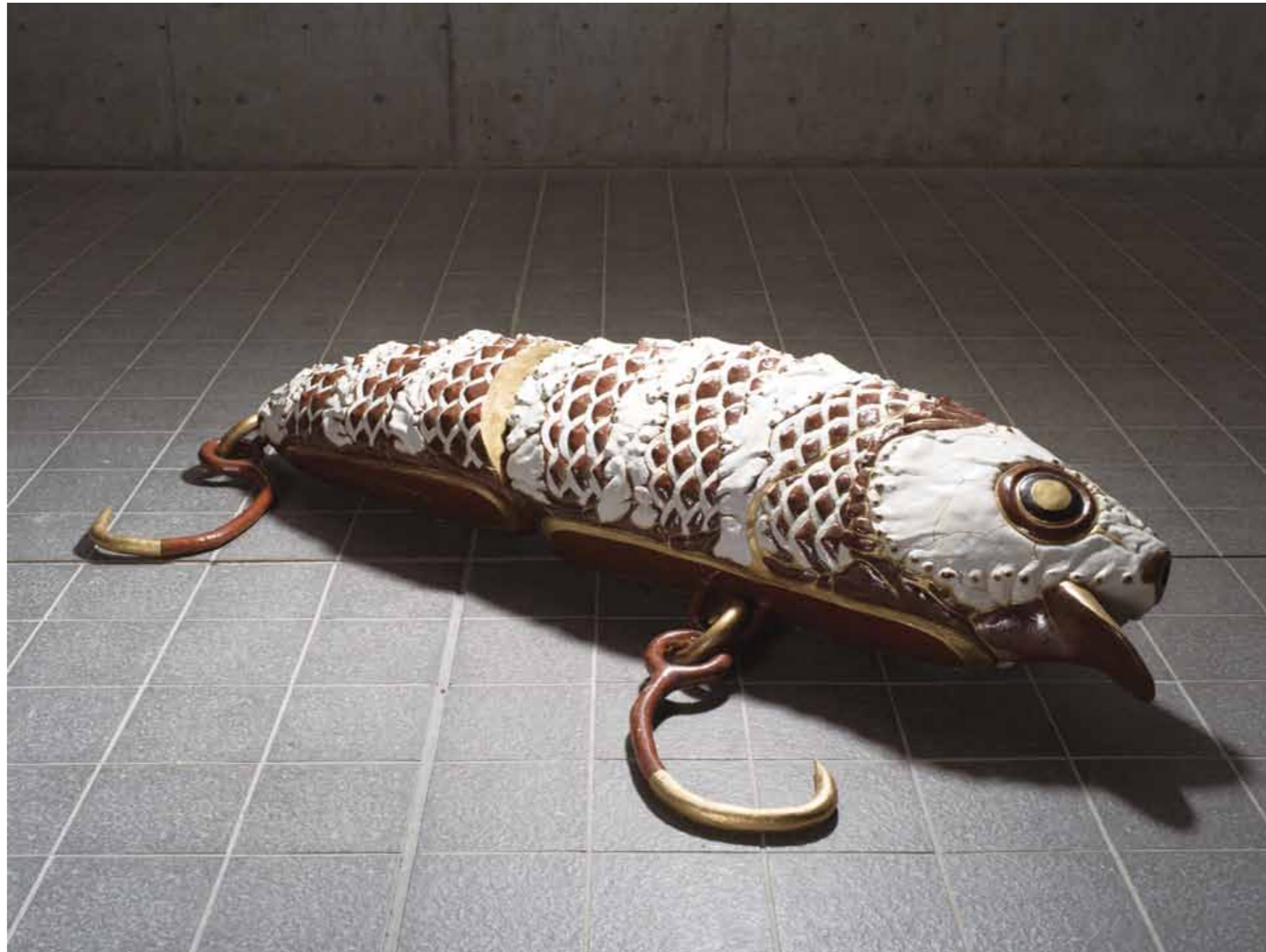
Ceramic minnow 陶 / Ceramic 38 × 198 × 30 cm