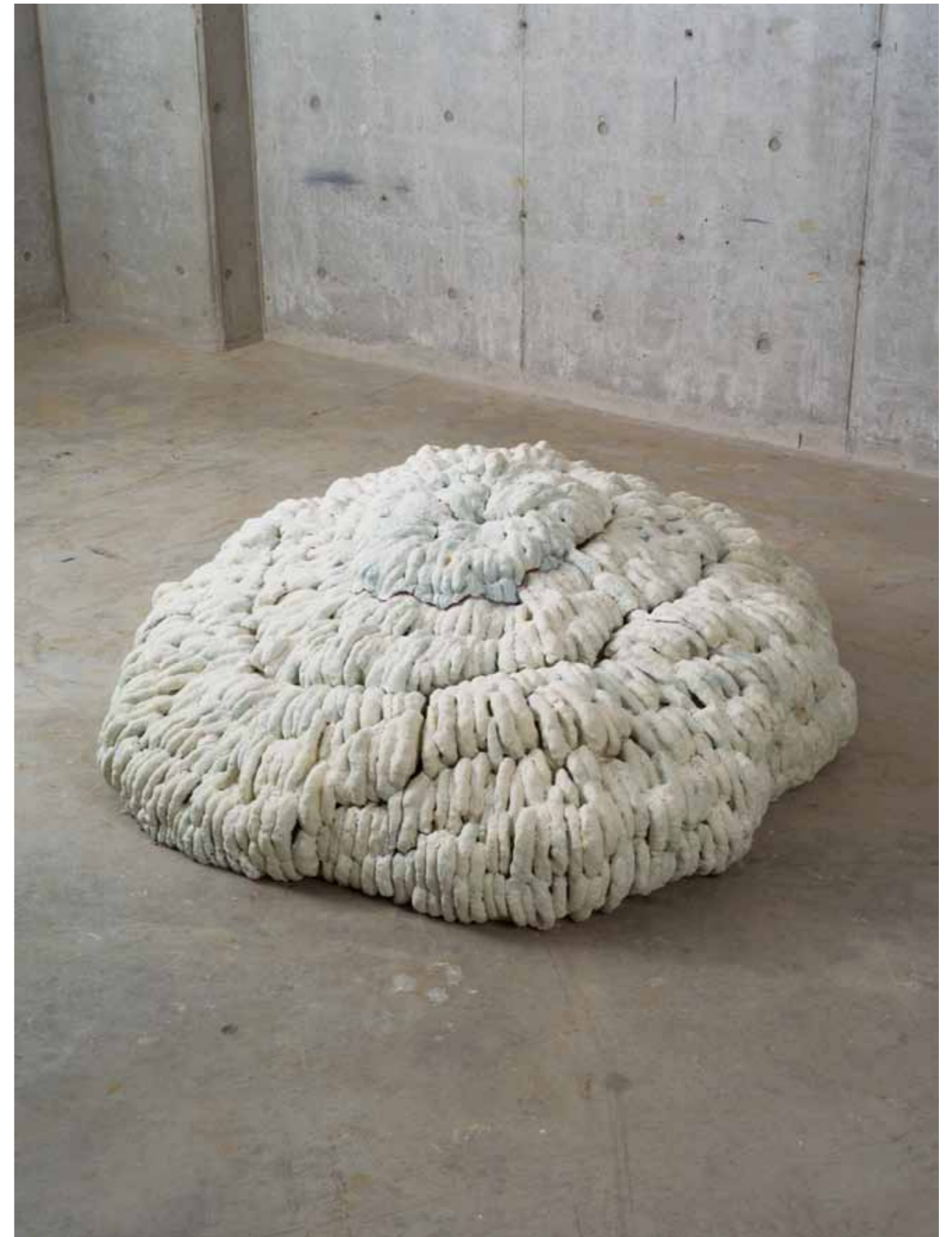
修了論文：人為と素材の脆弱性とのせめぎあいとしての「儚さ」 "Evanesence" that is made of the vulnerability of the artificial and material