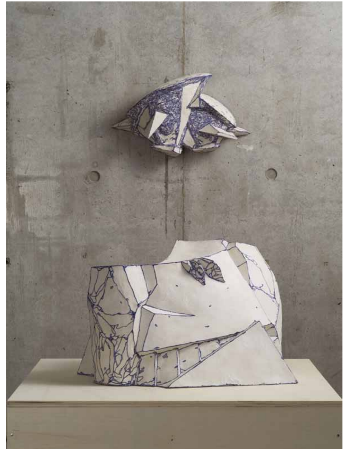
上 かべにめ'14 / Eyes on the wall '14 陶 / Ceramic 20.3 × 35.3 × 13.5 cm 下 M 陶 / Ceramic 28 × 44.5 × 41.5 cm

修了論文：現代日本を浮遊するイメージについて For the image to be floating in modern Japan