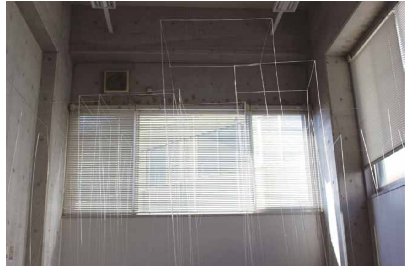
修了論文：ガラスにおける繊細さの表現 Expression of the delicacy in the glass