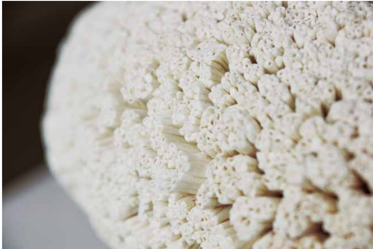
しゃり Shari 磁 Ceramic 32 × 30 × 30 cm

Creating an object in which it is difficult to distinguish between artifact and natural product