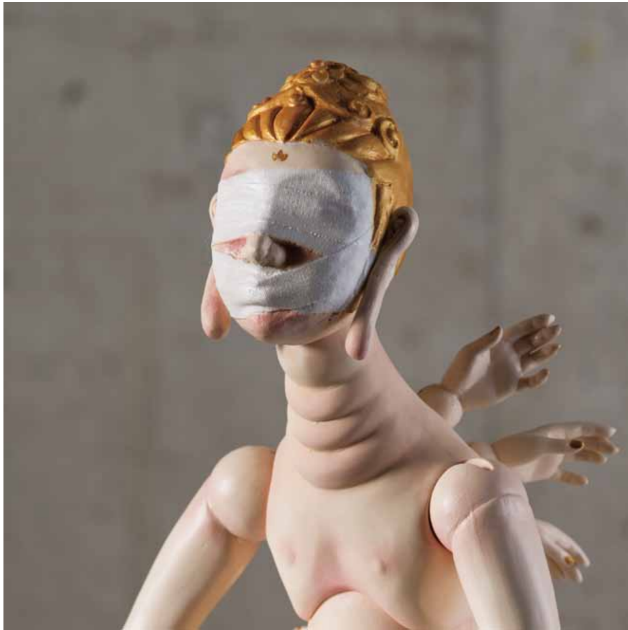
アイコン / Icon 陶、鏡 / Ceramic and mirror 40 × 60 × 60 cm