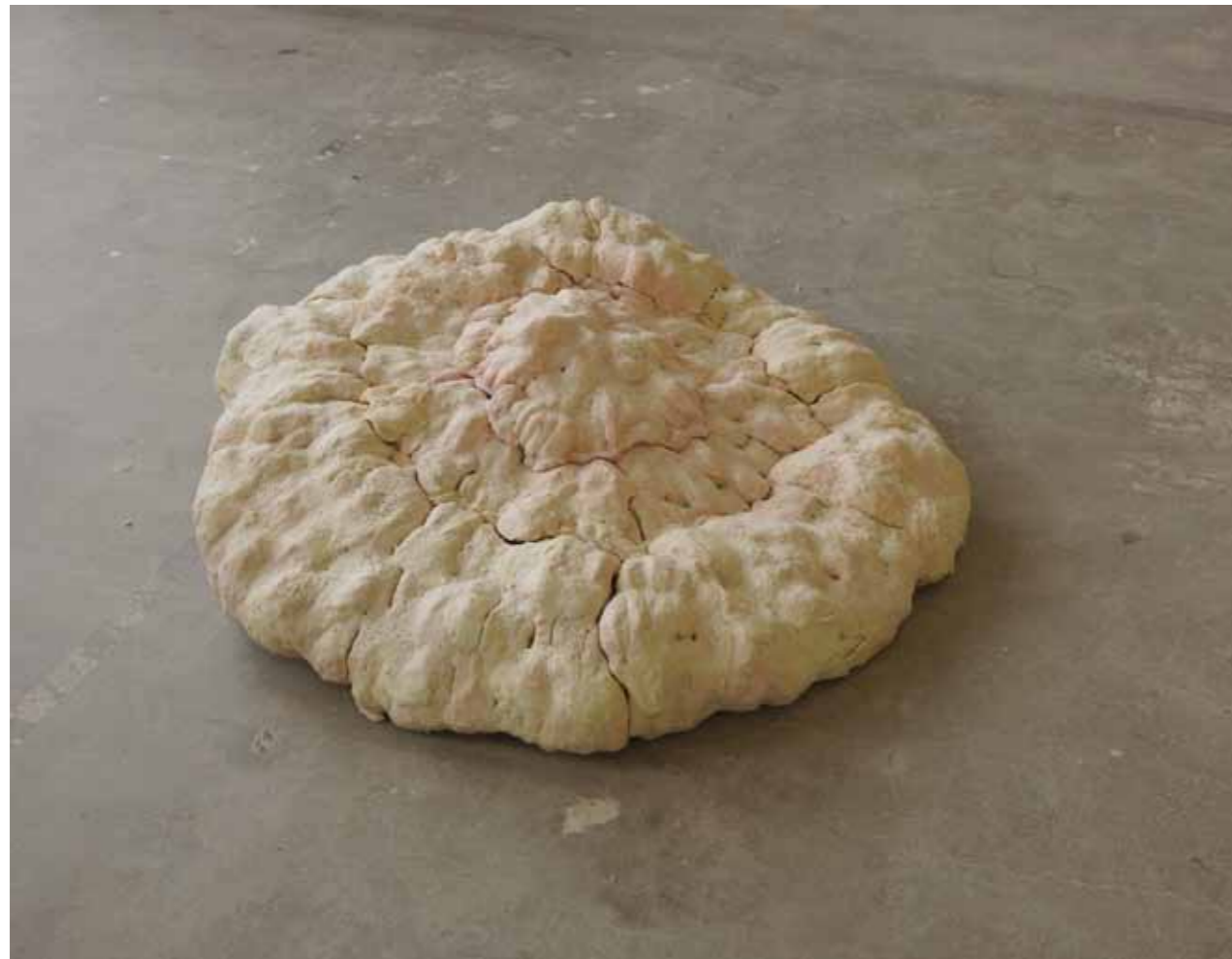
左 やおらかな変容 Leisurely change in appearance 陶 / Ceramic 24 × 106 × 108 cm