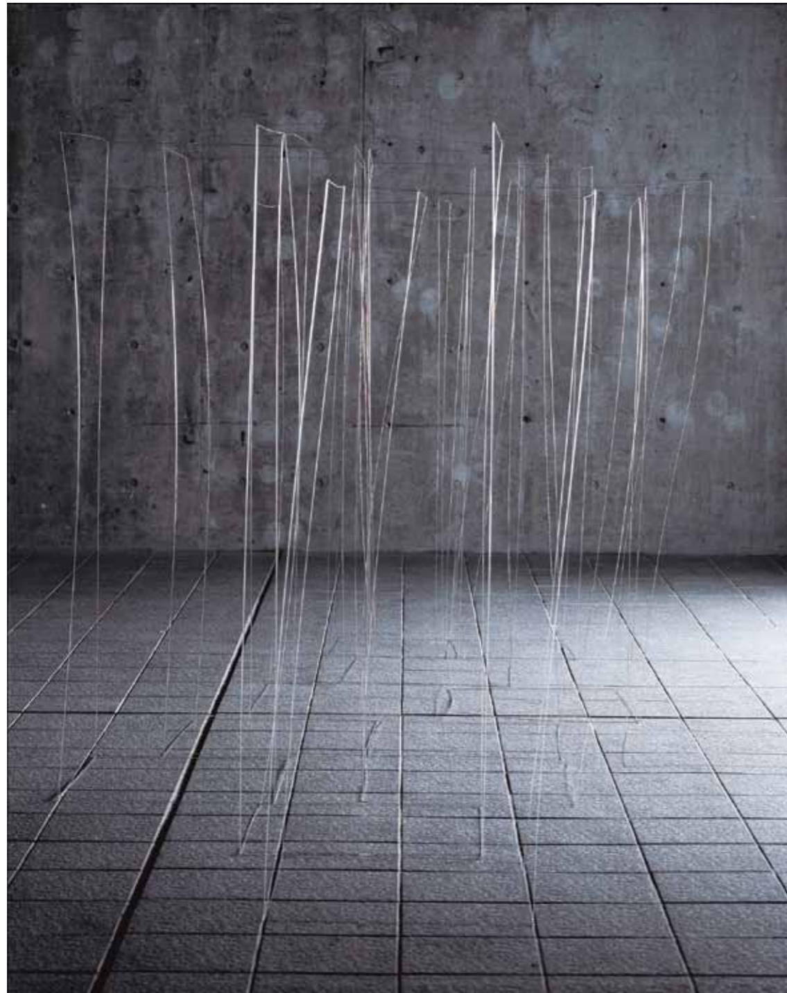
ゆれる空間 / The space that shakes ガラス / Glass / 120-80 × 40-30 × 40-30 cm