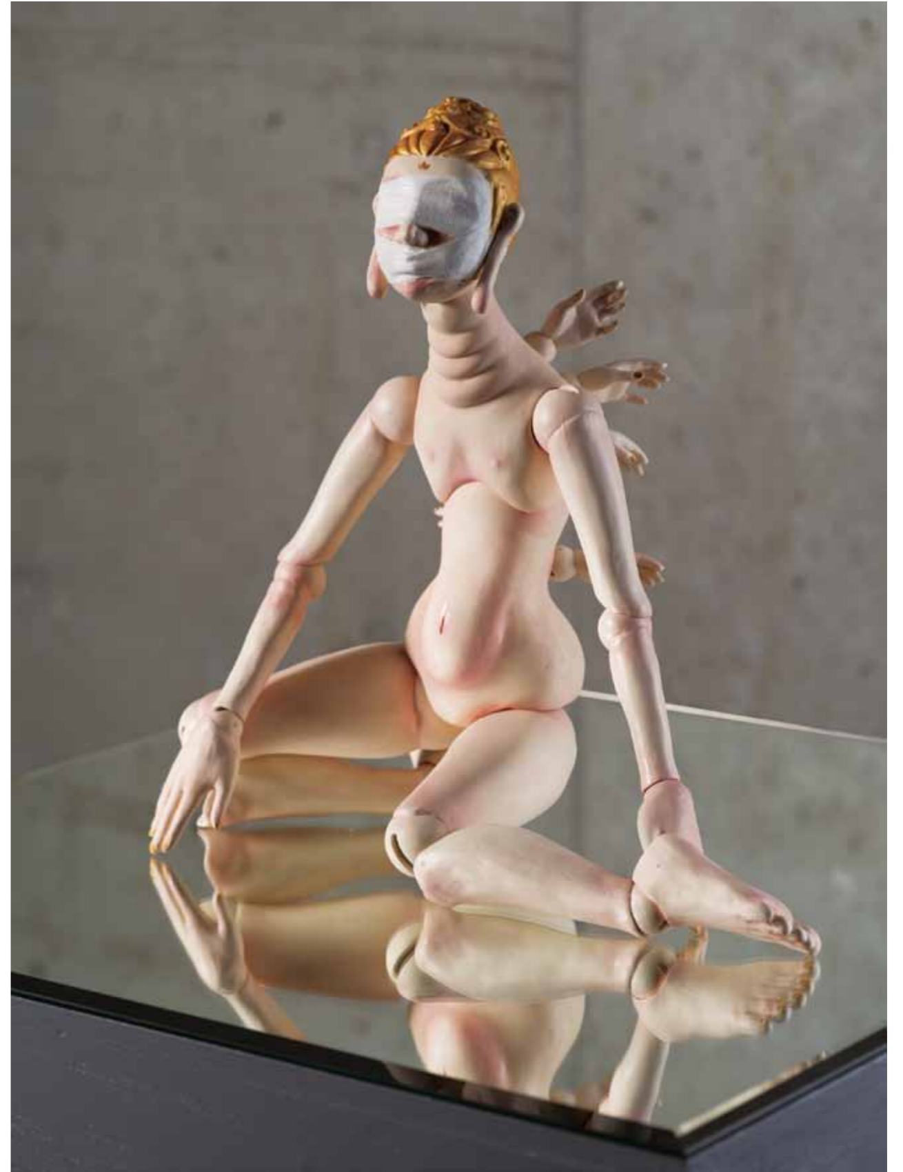
修了論文：アイコンによる再現 The artistic reproduction of icons