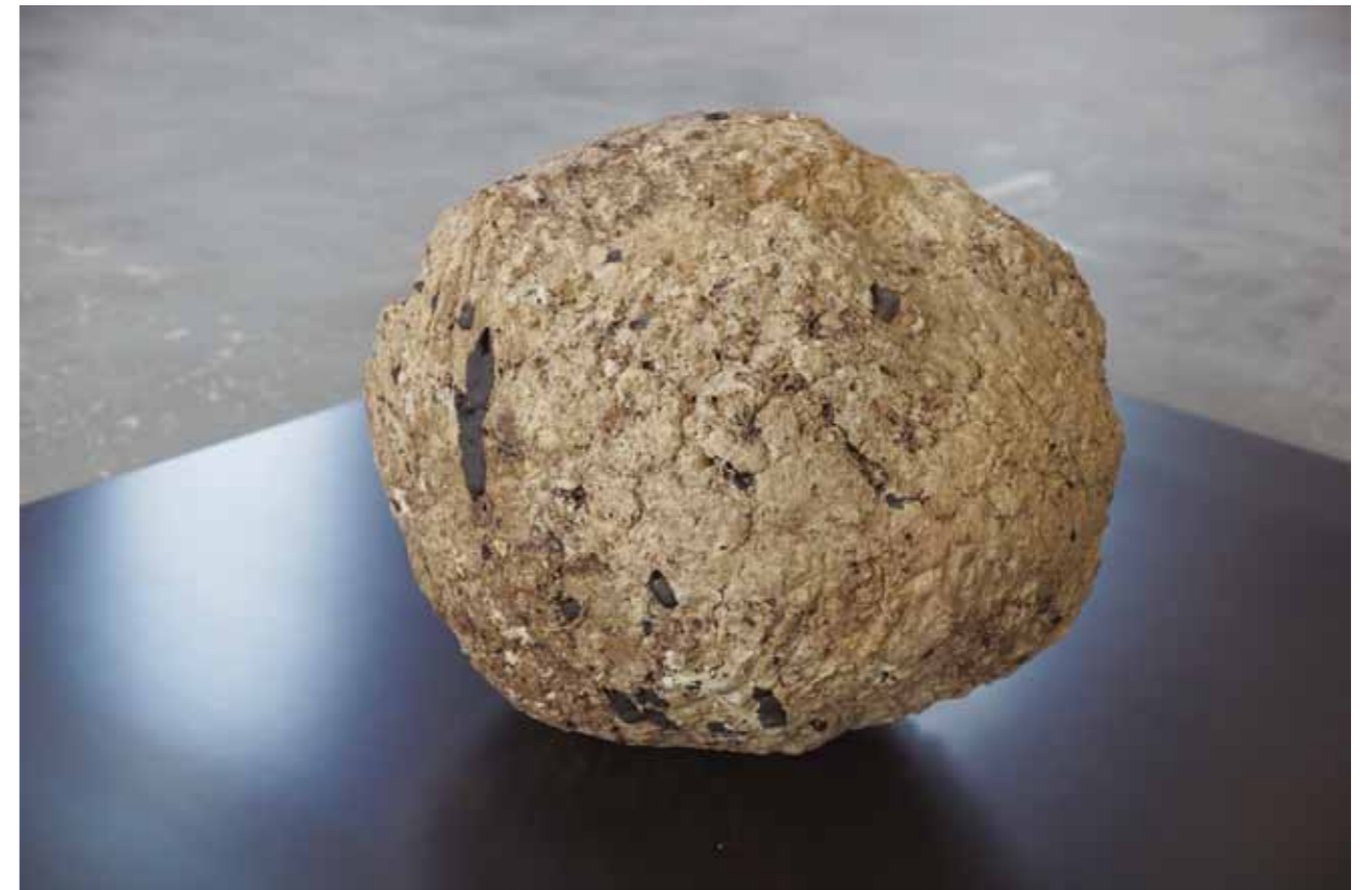
もともどるをくり還す / The circulation 陶、鉄 / Ceramic and iron / 45 × 45 × 30 cm 6 点

修了論文：詩的情景としての陶 Ceramic as a poetic scene