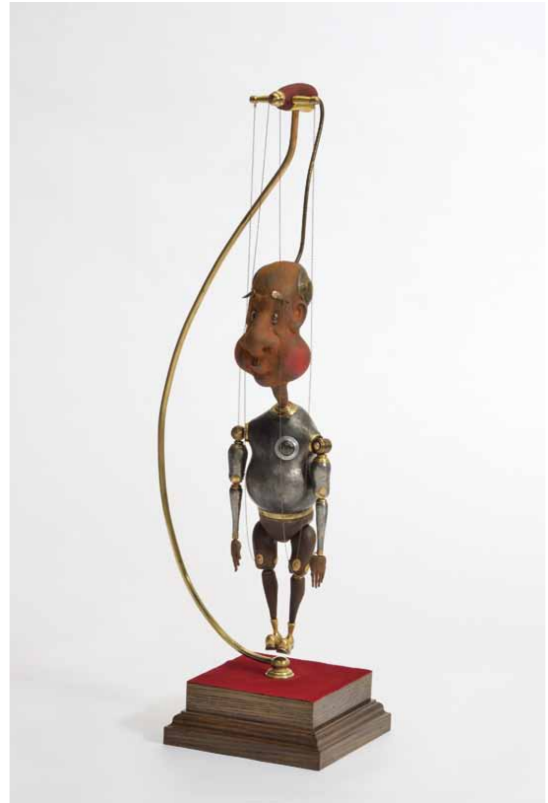
修了論文：モノとコトの狭間 Between a thing and a fact