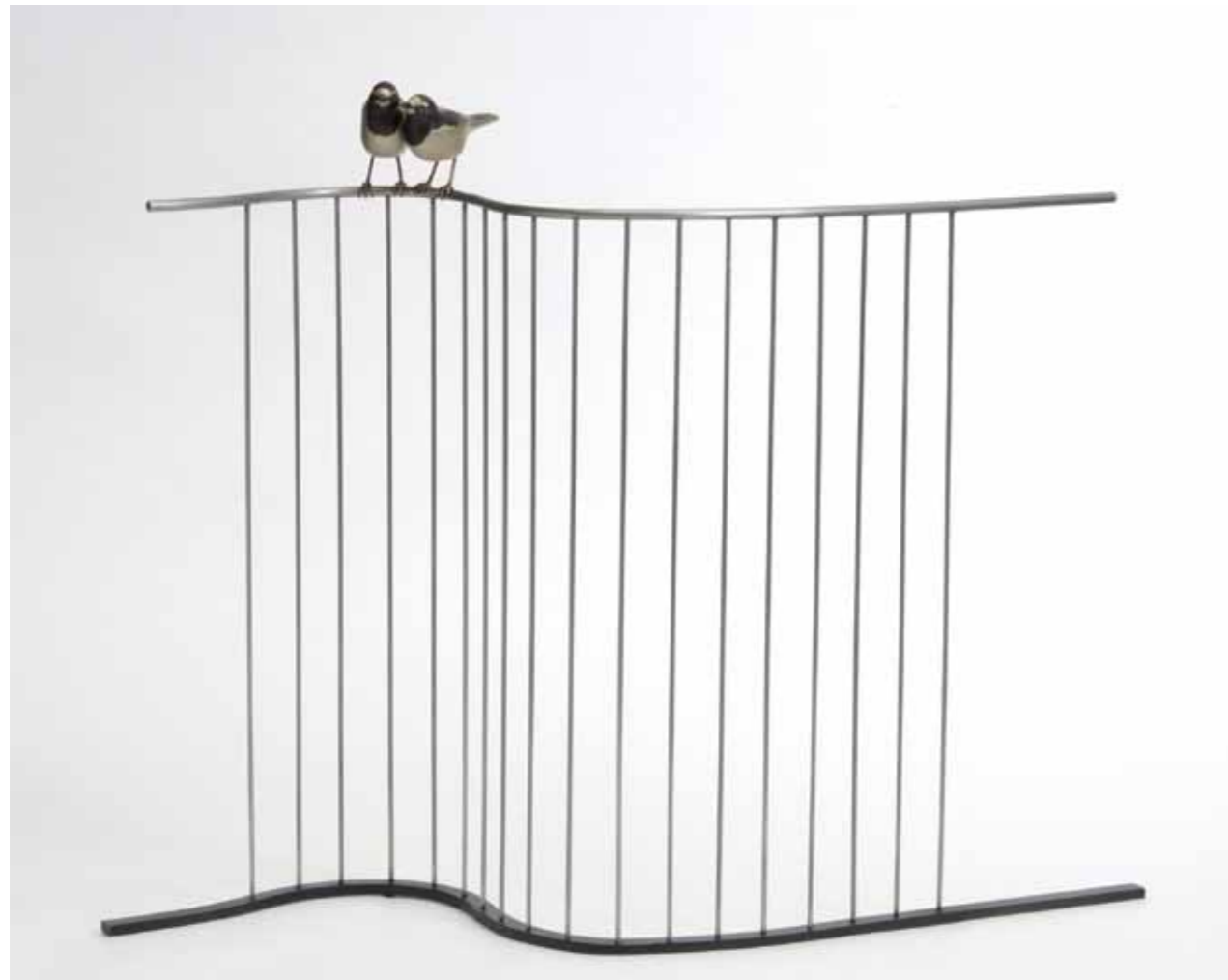
ふたり Two birds 銅、鉄 Copper and iron 68 × 80 × 28 cm