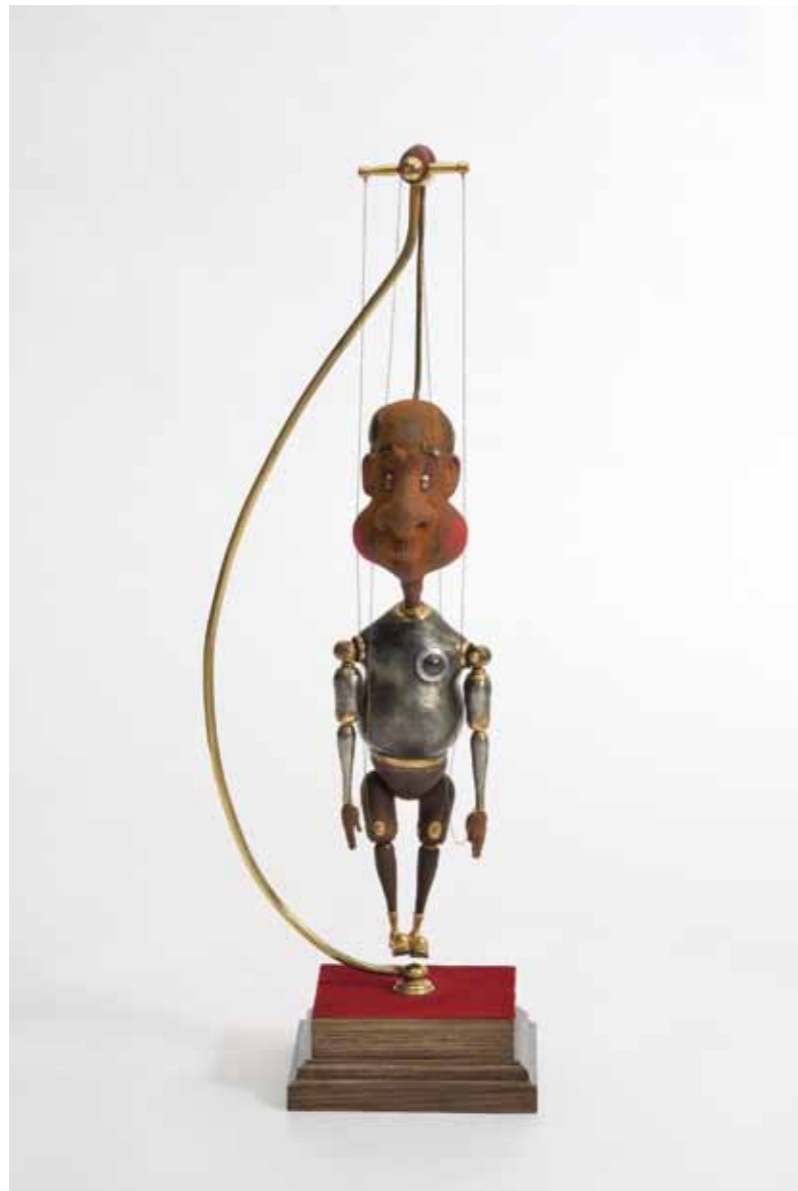
ひとり Alone 鉄、真鍮 Iron and brass 70 × 17.3 × 17.3 cm